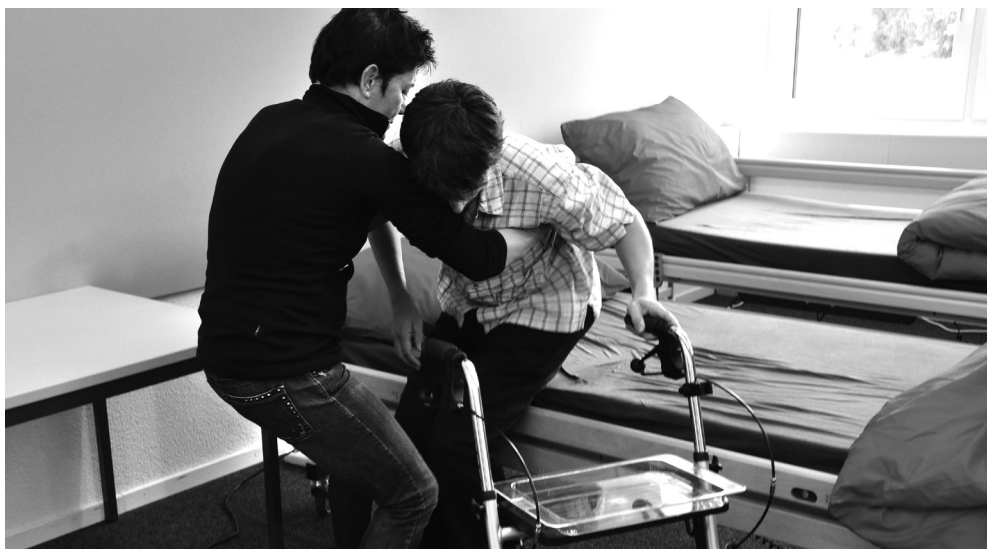
Dans le cours de formation «Assistance aux personnes âgées».

Depuis la mi-juillet, tous les cours de formation pour civilistes sont effectués dans un centre de formation centralisé à Schwarzenburg. L'Organe d'exécution pour le service civil veut ainsi améliorer la qualité des résultats apportés par les civilistes. De nouveaux cours sont d'ores et déjà planifiés.